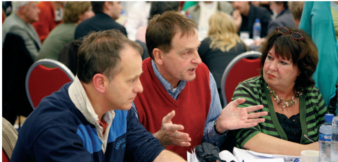
Discussie tijdens Dialogbijeenkomst 1 november 2006