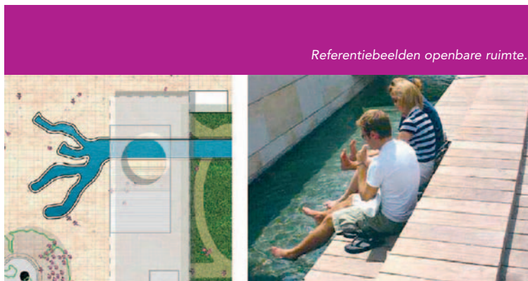
Referentiebeelden openbare ruimte.

cafés, restaurants, maatschappelijk, winkels, media, persoonlijke verzorging, et cetera) moet zodanig zijn samengesteld dat er zowel overdag als 's avonds bezoekers zijn op het Stadionplein. Bij maatschappelijke voorzieningen is te denken aan bijvoorbeeld huisartsen, peuterspeelzaal of kinderdagverblijf. De huidige kiosken op het plein kunnen in de oorspronkelijke vorm van de Olympische Spelen van 1928 worden teruggebouwd. Ze kunnen een belangrijke bijdrage leveren aan de gebruiksmogelijkheden van het plein.